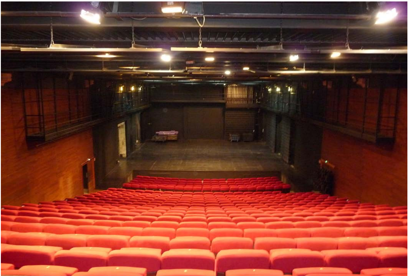
GRANDE SALLE VERSION JAUGE COMPLETE 482 PLACES